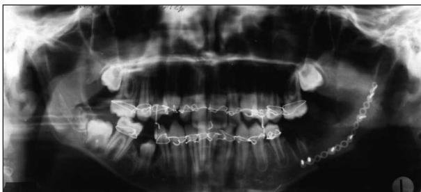
Obr. 4. RTG-OP - stav po resekci mandibuly vlevo a její rekonstrukci kostním štěpem z lopaty kyčelní kosti. Fig. 4. X-ray - OP: condition after the resection of mandible on the left and its reconstruction by bone graft from the ala of iliac bone.