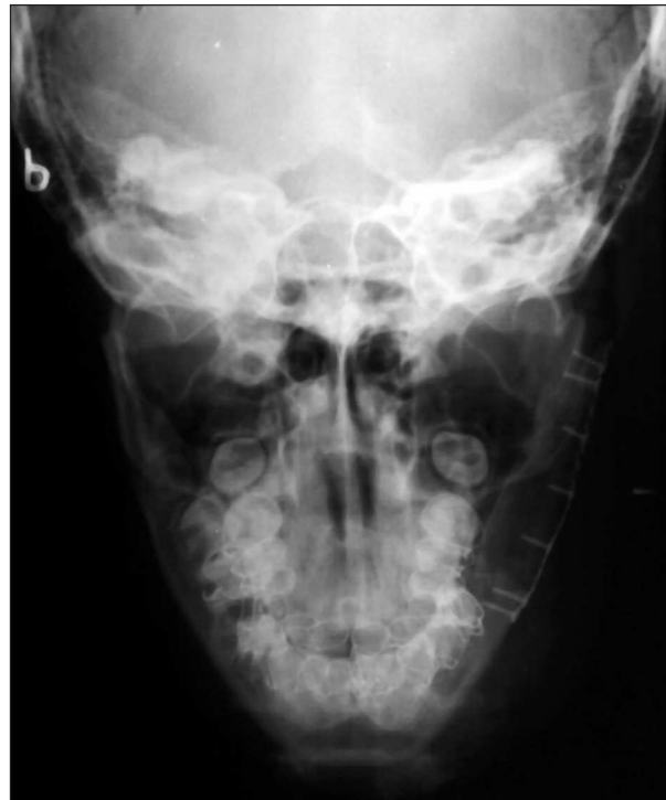
Obr. 5. RTG-AP lbi podle Clementsch - stav po resekci mandibuly vlevo a její rekonstrukci kostním štěpem z lopaty kyčelní kosti. Fig. 5. X-ray - AP: of cranium - condition after the resection of mandible on the left and its reconstruction by bone graft from the ala of iliac bone.