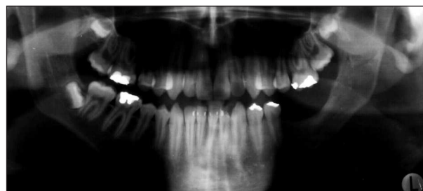
Obr. 6. RTG-OP - 3 roky po operaci, kostní štěp vhojen. Fig. 6. X-ray - OP: three years after the surgery, the bone implant healed up.

V celkové anestezii jsme provedli probatorní excizi a histologicky byla potvrzena diagnóza eozinofilního granulomu. Během kompletního přešetření (rtg, scintigrafie, sonografie), kdy nebyla zjištěna žádná další ložiska LCH, došlo u pacienta k závažné komplikaci - patologické zlomenině dolní čelisti. Proto jsme provedli resekci mandibuly a její rekonstrukci kostním štěpem z hřebene lopaty kosti kyčelní (obr. 4, obr. 5). Mezičelistní fixaci rozvolňujeme 34. den, osteosyntézu odstraňujeme po 10 měsících.