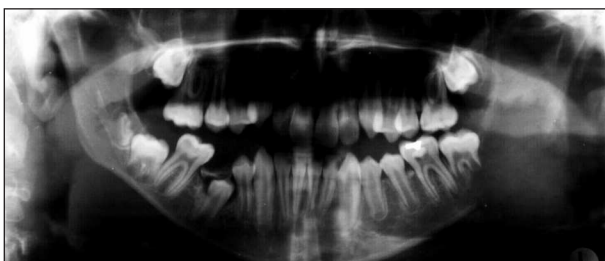
Obr. 3. RTG-OP osteolytické projasnění mandibuly vlevo. Fig. 3. X-ray - OP: osteolytic clearing of mandible on the left.