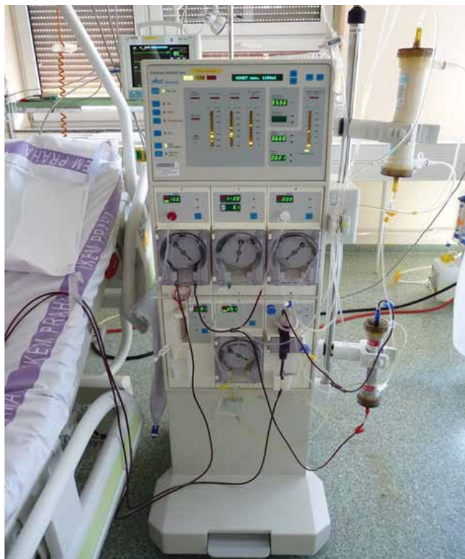
Obrázek 1. Aferetický přístroj nasetovaný na rheoferézu. Dole membránový filtr oddělující plazmu od krevních elementů, nahoře rheoferetický filtr vylučující makromolekuly. K posteli přichyceny setové linky mimotělního oběhu odvádějící z pacienta a vracející plnou krev zpět do oběhu pacienta

ronektinu [2]. Dochází ke snížení aktivity všech tří drah komplementu. To vede ke zlepšení viskozity krve a plazmy, ke snížení agregace erytrocytů. Nezávisle na základní chorobě dochází ke zlepšení mikrocirkulace. Fibrinogen a další globuliny, jako např. \alpha_2 -makroglobulin, jsou determinantami krevní viskozity a slouží jako makromolekulár-