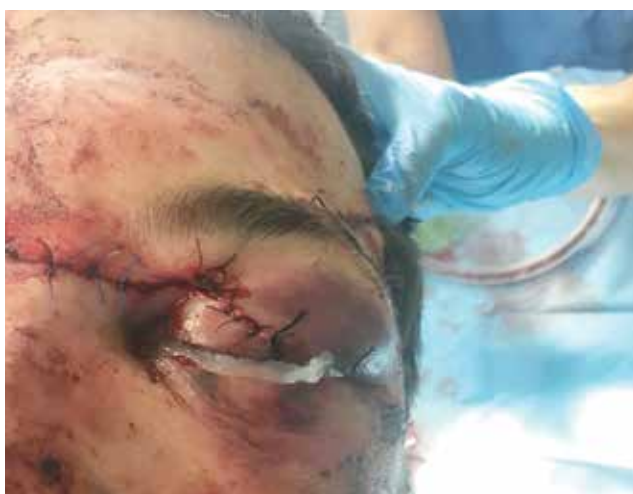
Obrázek 5-b. Stav bezprostředně po rekonstrukci víčka oftalmologem

[19]. Role MR je i důležitá v diagnostice traumatické neuropatie optického nervu.