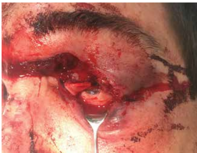
Obrázek 5-a. Profesionální poranění pilou. Rána na horním víčku je natolik hluboká, že došlo k poškození musculus levator palpebrae superioris

V případě orbitálního poranění pak vždy doplňujeme zobrazovací metodu, primárně CT [19]. CT vyšetření nám navíc může pomoci při nepřehledném nálezu vyloučit poranění očního bulbu – jeho sensitivita je v tomto případě kolem 75 % [20]. Navíc má nezastupitelnou úlohu při identifikaci cizího tělesa v očnici. Jedině pokud je definitivně cizí kovové těleso očnice či bulbu vyloučeno, můžeme přistoupit k vyšetření magnetickou rezonancí (MR). MR je užitečná při detekci některých organických cizích těles, či pro lepší přehlednutí formovaného hematomu