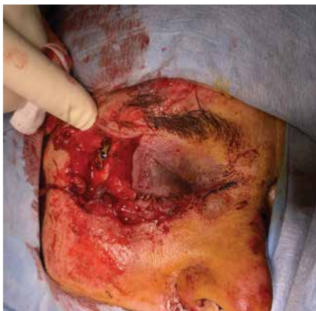
Obrázek 6-a. Těžké poranění očnice a víček při autonehodě. Je patrná již provedená rekonstrukce zlomeniny vnější stěny očnice stomatochirurgem

U všech traumat bychom měli ověřit, zda má pacient platné očkování proti tetanu a zda je rekonstrukci možné provést v lokální anestezii. Obecně ale platí, že pro rozsáhlá poranění víček, poranění slzných cest,