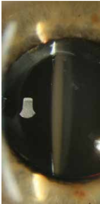
Obrázek 3. Přední segment – zkalená NOČ AcryNova™PC 610Y před explantací