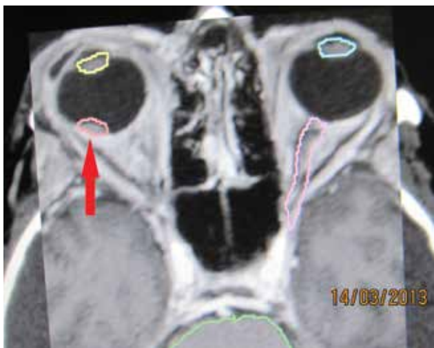
Obrázek 1. Nádorové ložisko – melanóm chorioidey v štádiu T1 - v blízkosti makuly zakreslené pred stereotaktickým ožiarением v r. 2013 – červená šípka

Analyzovali sme súbor 168 pacientov s malígnym melanómom corpus ciliare a chorioidey, ktorí podstúpili ste-