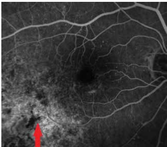
Obrázek 3. Fluoresceínová angiografia nádorového ložiska o 4 roky neskôr v r. 2017

reotaktickú rádiokirurgiu na lineárnom urýchľovači LINAC na Onkologickom ústave Sv. Alžbety v Bratislave v spolupráci s Klinikou Oftalmológie LF UK a UNB Ružinov v rokoch 2007-2016. Dávka ožiarenia na oblasť tumoru bola od 35,0 do 62,06 Gy, medián 40,13 Gy. Postradiačná makulopatia bola diagnostikovaná na základe nálezu na optickej koherentnej tomografii. Dáta boli retrospektívne vyhodnotené v januári 2018, teda sledovacie obdobie bolo 13-122 mesiacov.