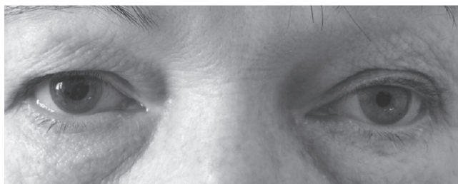
Obr. 2 Před aplikací kokainu měla zornice na pravém oku šířku 3 mm, na levém oku 2 mm (nahore). Hodinu po nakapání kokainu se pravá zornice rozšířila na 5 mm, průměr levé zornice se nezměnil (dole). Kokainový test potvrdil, že se jedná o Hornerův syndrom