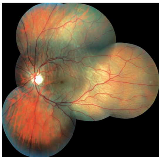
Obr. 1 Kvadrantová amoce zasahující centrální krajinu.

Indicie k provedení operace amoce zevním postupem byly téměř ve všech případech obdobné: mladý pacient s čirou