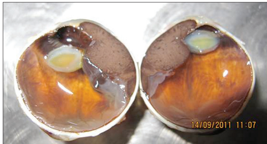
Obr. 1. Malígný melanóm corpus ciliare v štádiu T3N0M0 so sublúxiou šošovky a pre-rastaním do prednej očnej komory

Okrem veľkosti ovplyvňuje prognózu aj tvar nádoru (obr. 1). Za agresívnejšie sa považujú difúzne formy rastu MMU, a v prípade MM dúhovky a corpus ciliare tiež prstencový rast nádoru.