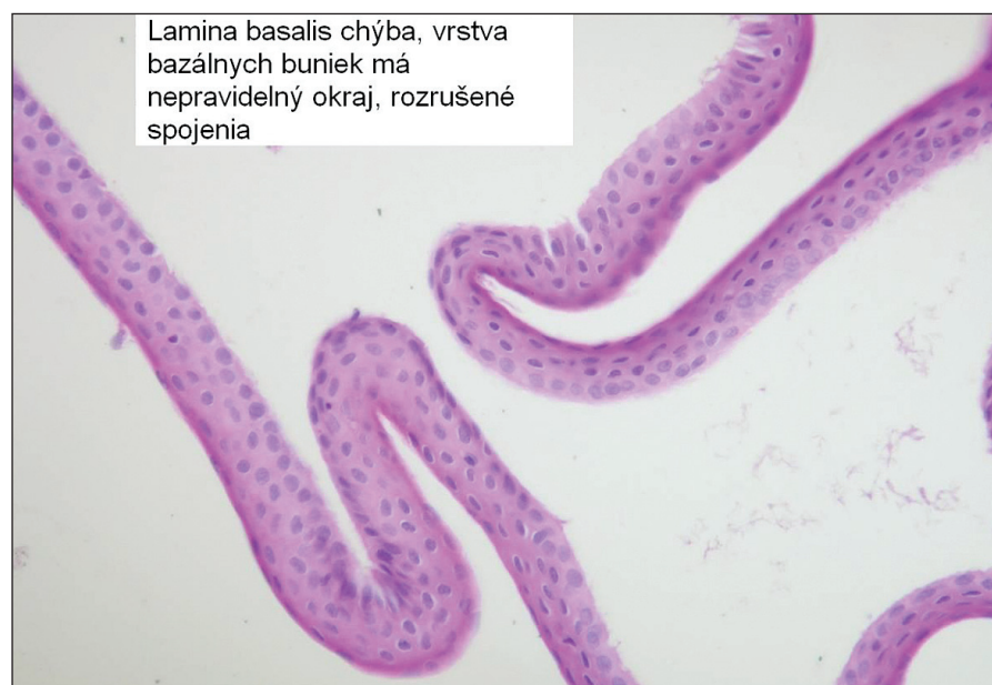
Obr. 2. Epiteliálny flap vytvorený s pomocou alkoholu, lamina basalis nie je prítomná