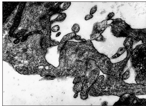
Obr. 2. Jednovrstevná buněčná epimakulární membrána. Zvětšení 33 000×