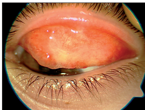
Obr. 3. Tarzální spojivka 1 rok po kryokoagulaci