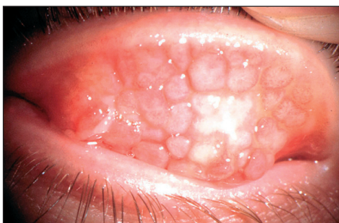
Obr. 1. Papilární hypertrofie před kryokoagulací

teplotou -80\text{ }^{\circ}\text{C} po dobu 60 s. V průběhu léčby pacienta jsme tak, jak byly na trh postupně uváděny nové účinnější preparáty, ať již v kategorii preventivní (stabilizátory žírných buněk), nebo symptomatické (antihistaminika), měnili i léčbu farmakologickou. Po provedení kryokoagulace jsme nasadili lodoxamid 1% (Alomid, Alcon) ze skupiny stabilizátorů žírných buněk v kombinaci s antihistaminiky – emedastin (Emadine, Alcon), celkově potom loratadin (Claritine, Schering-Plough). Po celou dobu sledování jsme spolupracovali s alergologem, který řídil celkovou léčbu. Chlapec docházel na pravidelné kontroly. Zraková ostrost se již po 1 měsíci upravila na 1,0 oboustranně. Nález vpravo zcela v normě, vlevo bulbus klidný, tarzální spojivka se zjizvením po kryokoagulaci, bez papilární hypertrofie. Rohovka lesklá, transparentní, s drobnou nubekulou v horní části, vaskularizace zcela ustoupila (obr. 3, 4). Při poslední kontrole 28. 2. 2005 jsou bulby klidné, bez hypertrofie papil jen při aplikaci stabilizátorů žírných buněk – lodoxamid 1% (Alomid, Alcon) a alergologem indikovaném Staloralu (purifikovaný alergenový extrakt pro specifickou alergenovou imunoterapii). Od provedení kryokoagulace je náš pacient zcela bez obtíží.