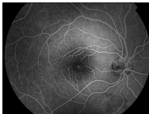
Obr 2: Pozdní venózní fáze fluorescenčního angiogramu

Za 3 týdny po vstřebání plynné tamponády nebyla biomikroskopicky retino-