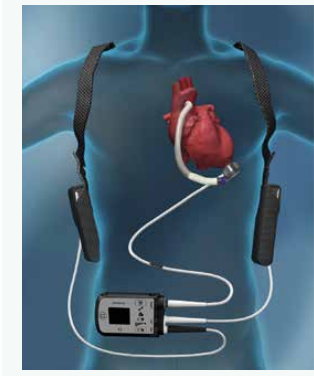
Obr | Mechanická srdeční podpora HeartMate 3 (použito se svolením společnosti Abbott U.S.)