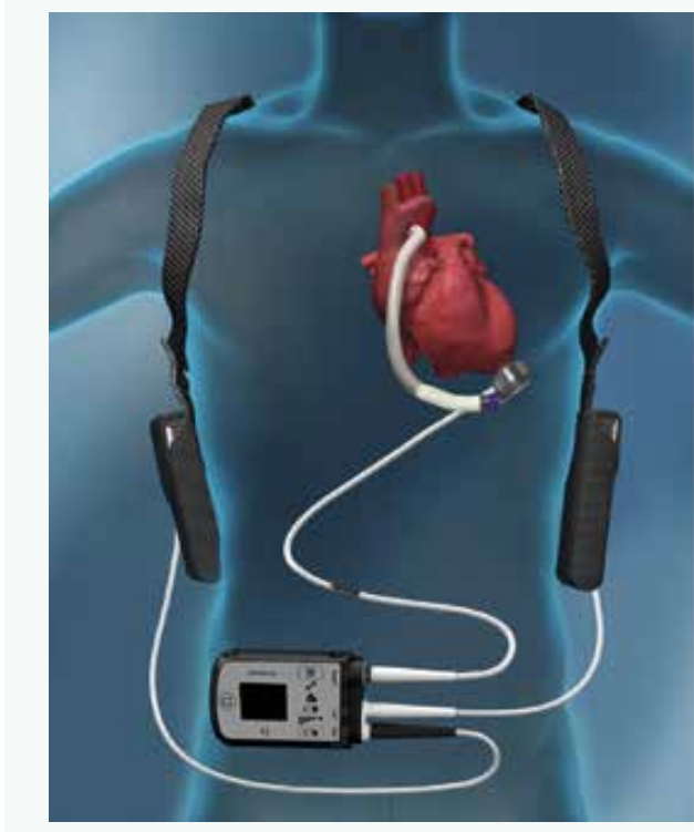
Schéma | Vliv implantace mechanické srdeční podpory (Heart Mate II nebo 3) a cévních parametrů (pulzilitního indexu v karotických tepnách a augmentačního indexu) na klinické příhody (median sledování 27 měsíců)